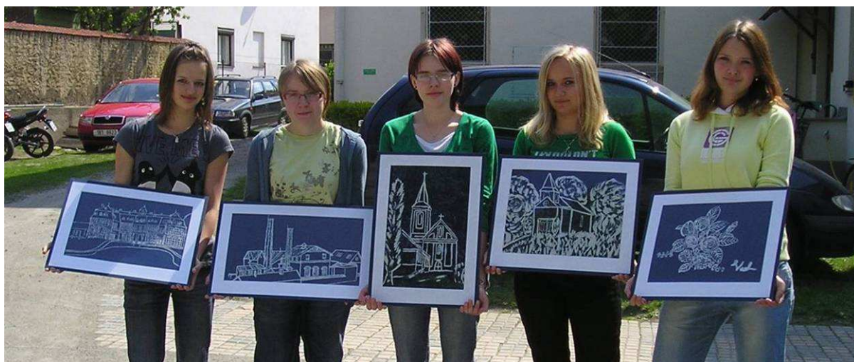
Studenti si v rámci projektu vyzkoušeli i techniku modrotisku.

V rámci projektu byl vytvořen čtyřjazyčný česko-litevsko-anglicko-německý slovníček, dvojjazyčná česko-německá publikace o tradicích, prezentace koordinátorky projektu v Praze, prezentace projektu pro veřejnost, výstava fotografií z návštěvy v Litvě a další akce (např. pečení perníčků, poznávání starých předmětů, ...)