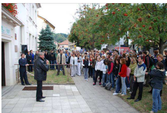
Odhalení pamětní desky na budově školy