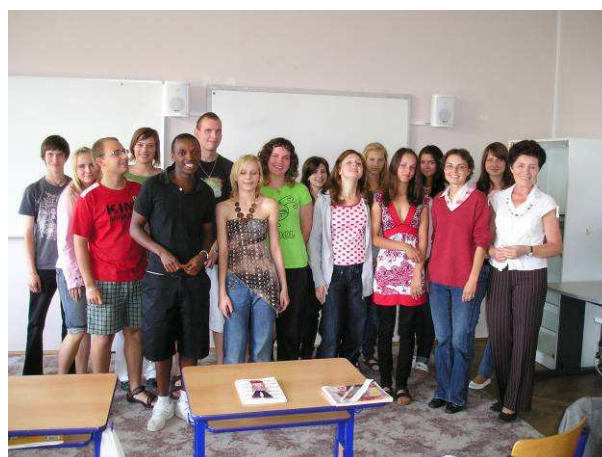
Beseda s rodilým mluvčím ve francouzštině