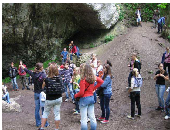
Škola v přírodě