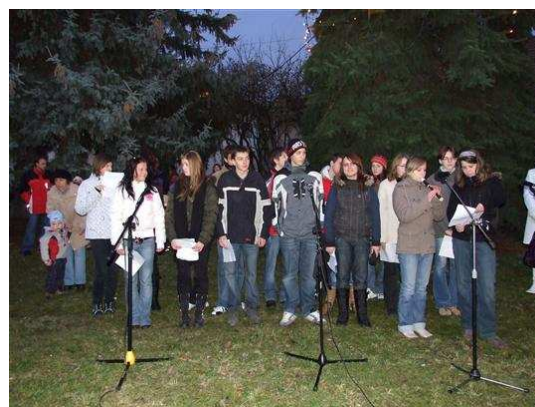
Vystoupení studentů při Rozsvícení Vánočního stromu