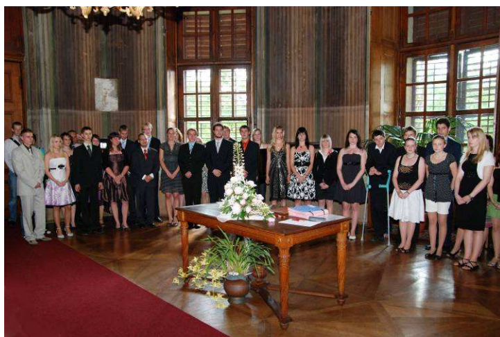
Slavnostní předávání maturitních vysvědčení na zámku v Rájci-Jestřebí